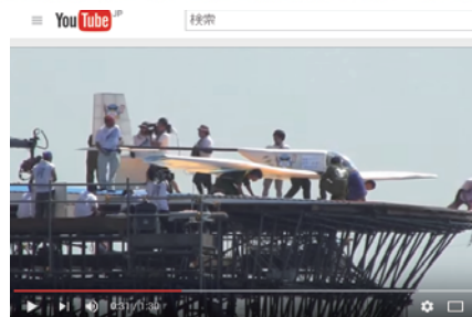
鳥人間コンテスト2014 滑空機部門 12/17 新居浜高専 Team Migrant